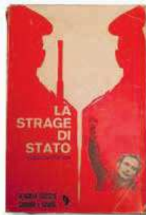
La copertina della prima edizione della controinchiesta «La strage di Stato», pubblicata nel 1970 dall'editore Samonà e Savelli