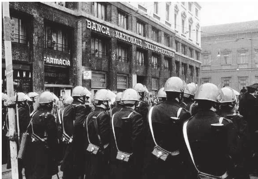
12 dicembre 1989, manifestazione nell'anniversario della strage.

L'esplosivo che sarà alla fine rinchiuso in una cassetta metallica Jewel (poco meno di tre chili), trasportato da due esponenti di Ordine nuovo nel bagagliaio di una vecchia 1100, venne periziato qualche giorno prima del 12 dicembre in un luogo tranquillo ai bordi di un canale a Mestre dall'esperto in armi della