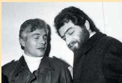
Per la Cassazione (2005) gli ordinatori Franco Freda e Giovanni Ventura furono tra i responsabili della strage, pur non essendo più processabili per quella vicenda

Pene minori per alcuni membri dei servizi segreti; 12 agosto 1979 A Buenos Aires viene arrestato Ventura; 23 agosto 1979 Freda viene arrestato in Costa Rica; 22 maggio 1980 A Catanzaro comincia il processo d'Appello; 20 marzo 1981 Sentenza del processo d'appello: tutti assolti per la strage di Piazza Fontana. Freda e Ventura condannati a 15 anni per le bombe di Padova e Milano del 1969. Confermate le condanne per Valpreda e Merlino; 19 giugno 1982 La Cassazione annulla la sentenza d'Appello di Catanzaro; 23 dicembre 1982 Nell'ambito di una nuova indagine sulla strage, la procura di