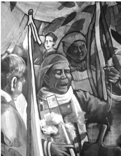
Detalle de mural en el local del COPINH

Uno de los objetivos centrales de esos acuerdos era el regreso de Honduras a la OEA, en la reunión de la 41° Asamblea General convocada para el 5 de junio de ese año en San Salvador. El gobierno norteamericano presionó en esa dirección a los distintos gobiernos, porque necesitaba cerrar sus acuerdos “de seguridad”, y de “libre comercio”, con una Centro América unificada.