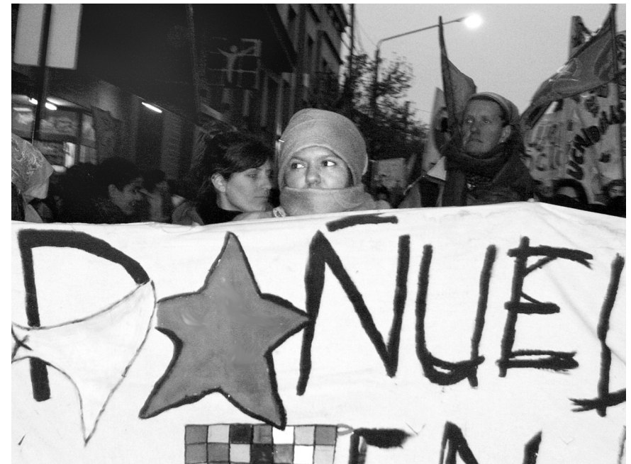
Berta marchando en el Encuentro Nacional de Mujeres de Bariloche, 2011

nifestaciones de racismo de esos liderazgos de la Resistencia. Por ejemplo, Mel Zelaya dijo que de nada servía que anduviéramos en la calle, porque los pueblos indígenas habíamos pasado -decía él- 500 años pidiendo migajas. Eso nos pareció una expresión de racismo, de desprecio a la lucha indígena, también de ignorancia, desconocer que la resistencia histórica de los pueblos indígenas ha sido grandiosa, un gran aporte a las civilizaciones, a la evolución de toda la humanidad. Hay una carta que lanzamos el mismo 9 de agosto, al día siguiente, donde hicimos un cuestionamiento a eso.