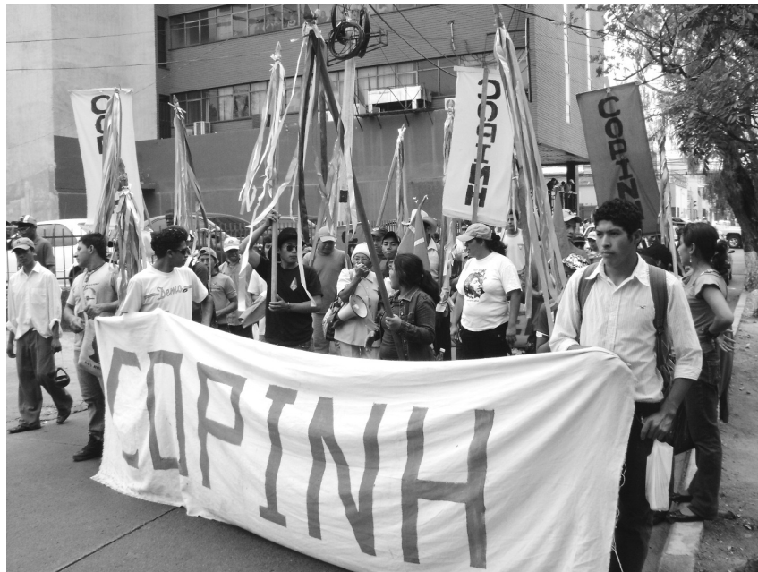
El COPINH en la primera línea de la Resistencia

En Honduras se vienen librando batallas sordas, invisibles para la mayoría de nuestros movimientos, cuyas consecuencias sin embargo impactan en todo el continente. Una aproximación a esta parte de la historia se produjo cuando el golpe de estado del 28 de junio del 2009 “sorprendió” a una América Latina que creía que estas modalidades de intervención violenta habían “pasado de moda” en la agenda imperialista. Es necesario pasar de la sorpresa al análisis de los nexos y contradicciones existentes entre las políticas hegemónicas y las resistencias de los pueblos, que hacen de Nuestra América un único espacio en el que se continúan librando múltiples batallas por la independencia, la autonomía, la libertad, el buen vivir.