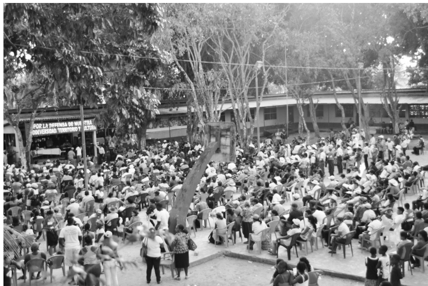
Asamblea de Pueblos Indígenas y Negros de Honduras