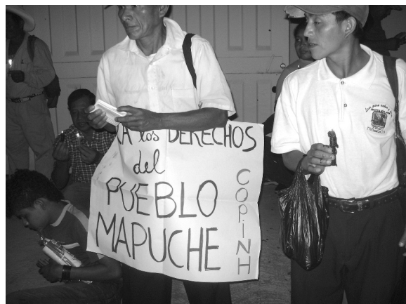
Movilización de COPINH en los primeros días del golpe de estado a la Embajada de Chile para exigir justicia para el pueblo mapuche.

Es una gran pérdida para el pueblo, y para las mujeres, como ejemplo de lucha en defensa de la tierra y del agua.