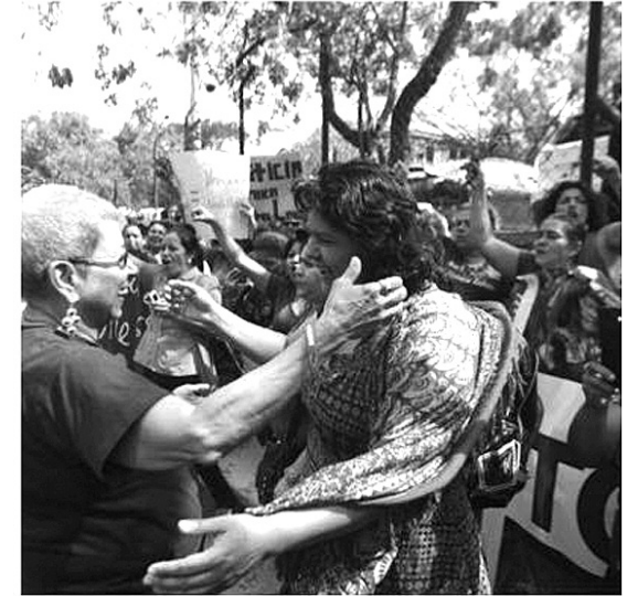
Berta Cáceres con Gladys Lanza, defensora de los derechos de las mujeres