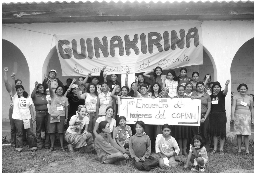
Organización, formación y movilización de las mujeres de COPINH