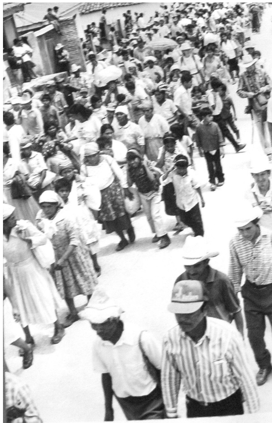
Primera peregrinación hacia Tegucigalpa

Honduras ha sido históricamente un laboratorio de ensayo de las políticas del poder oligárquico e imperialista en el continente. Cuando se produjo el golpe de estado el 28 de junio del 2009, el primero del siglo XXI, muchos movimientos populares y de las izquierdas lo asumieron con incredulidad. Se creía “superada” la etapa de los golpes producidos en los años 70.