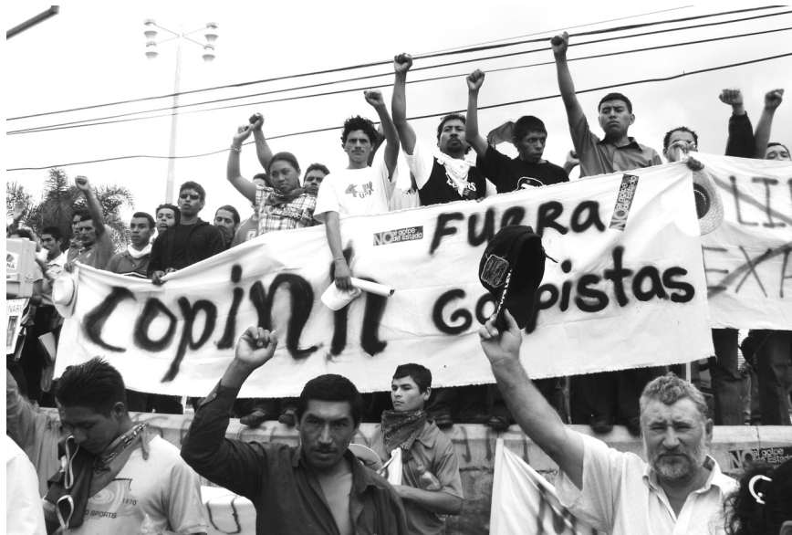
Movilización de la Resistencia a pocos días del golpe de estado

pismo está empezando a dar sus señales de que puede ir más allá. Lo está haciendo con Flores Lanza 81 que es una pieza muy emblemática de los políticos que acompañan a Mel Zelaya, y después puede seguir con cualquier otro de estos funcionarios reconocidos. Nosotros cuando hablábamos con Mel Zelaya, le decíamos incluso de la posibilidad de un magnicidio, pueden intentar asesinarlo. Esto sigue latente. Nosotros creemos que el golpismo es capaz de todo eso. El respeto a los derechos de las personas no se da, el respeto a los derechos humanos no se da, el respeto a los acuerdos y a los estados no se da. Ésa es la situación en este país. Éste es el drama de la realidad, que ni la OEA, ni quienes apoyaron esos acuerdos están viendo.